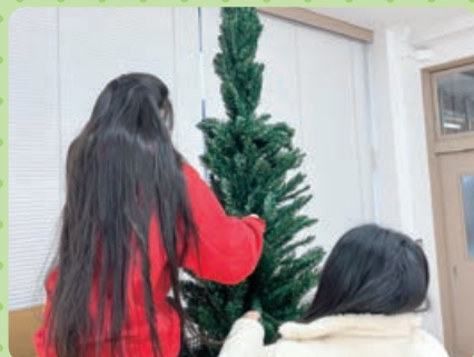
クリスマスツリーづくり(吾郷地域)