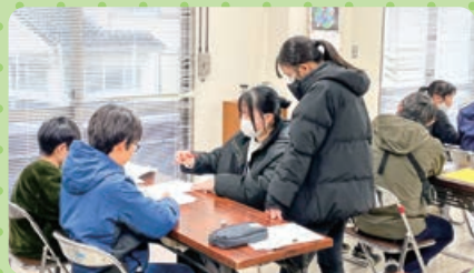
サタデースクール(桜江町)

島根中央高校には、様々な地域から、多くのボランティアのお声がけをいただきます。その様子を少しお届けします!