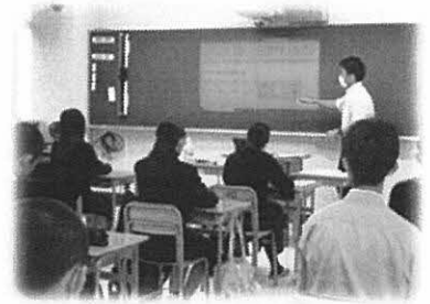
科目選択説明会の様子→

3年生になると選択科目が増えるため、自分の進路希望に沿った専門科目をより多く選択することができます。説明会では、各授業の担当教員から、授業を選択するのに望ましい進路や授業内容についての説明を受けました。