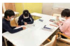
学習ルーム使用の様子▶

今回は、今年度より新たにスタートしたこちらの取り組みを紹介！学校が閉じている土日・祝日に学習できる場所があったらいいな！という声をもとに、町内の施設(かわもとおとぎ館/C Pieces+)を利用できるようになりました。どちらもWi-Fi環境が整っており、静かに自分のペースで学習できる環境です。また、C Pieces+では、月に2回程度、大学生による学習サポートを受けることができます。