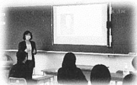
よいコミュニケーションとは？

講座では「なぜコミュニケーションを学ぶのか」大学で学ぶコミュニケーションについての模擬講義、「石見神楽を世界に向けて発信する」先生の研究についてのお話の他、入試のための「英作文の学習方法」について紹介いただきました。