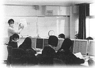
ネットでの情報収集