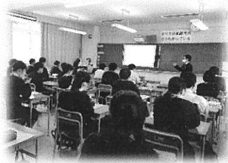
4年生大学志望の教室