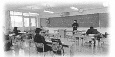
勉強会 自学の時間