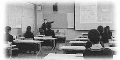
予備校講師の講演