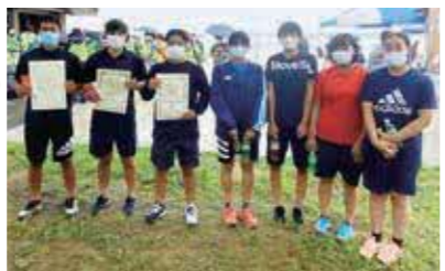
カヌー部集合写真