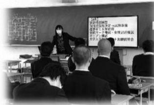
(写真) 1,3年生の学年集会の様子

4月第2週目に学年集会を行いました。進路指導部からは、高校生活と進路について各学年での心構えや、やるべきことなどについて進路指導部長より話しました。