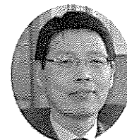
卒業生の皆さん、卒業おめでとうございます。また保護者の皆さま、お子

様のご卒業おめでとうございます。それぞれの皆さんが本校での三年間を終え、新たな未来に向かって飛び立られることを心からお祝いをいたします。 今回卒業の皆さんは島根中央高校の九期生として入学されました。学校として高校魅力化事業に取り組み、積極的に県外からの入学生の募集を開始してから四年目の学年になります。当時の学要要覧を確認しますと、それまで数名だった県外からの入学生が、事業三年目に十八名、そして皆さんの学年が二十二名となっており、本校の環境が大きく変化した時期の在校生ということになります。 何事も変化の中を進んでいくには相当の勇氣と努力が必要ですが、本校では生徒の皆さんの努力はもちろん、教職員と保護者の皆さんの協力、そして地域の皆さんの力強い支援をいただきながら様々な取り組みを進め、これまでに島根中央高校の「新しい魅力」が少しずつ形作られてきています。そして、新しい学校の姿を作り上げてきた卒業生の皆さん、改めてお礼の気持ちを伝えたいと思います。