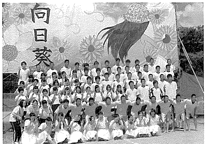
ヒマワリ 第2分団「向日葵」