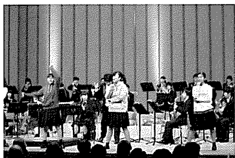
写真は創立10周年記念演奏(H29.11.19)

「保護者の皆様、地域の皆様と楽しい時間を作りたいと思います。皆様のご来場お待ちしております」