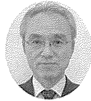
三年生の皆さん、ご卒業おめでとうございます。 この春も、多

く子ども達が学び舎を巣立ち、それぞれを描く新たな道を歩み始めることとなります。特に島根中央高校の場合は、地元だけでなく県外をはじめ多くの地域から集まった生徒たちが共に学んできたこともあり、他では経験できないような様々な出会いや体験をしたのではないのでしょうか。その一つひとつがこれからの自分自身の糧となり、これからの人生の中で活きれば良いと思います。夢の実現に向け、自分の人生の設計図を描き、まっしぐらに進んでいくってください。 いつも隣の席にあった友達の手や顔や先生たちの姿、遠くから聞ける部活動など様々な音、そんな日常が明日からはなくなり、線も三月末には姿を消すこととなります。 しかし、みんなが新しい道歩み始めるころには、いつもの年と同じように満開の桜が咲くことでしょうか。そして、周りには新しい友達ができ、新しい様々な音も聞こえてきます。日々の生活やそれぞれの人生では、変わりゆくもの