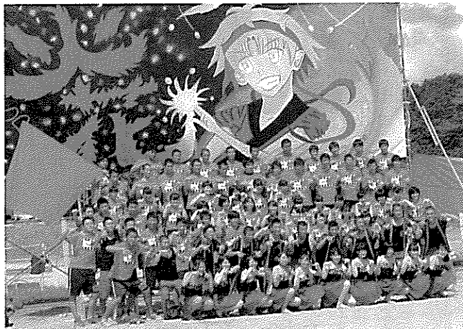
ヒバナ 第1分団「火花」

君たちは、これから長い人生「辛い」ことがあると思いますが、「希望」という一本の「棒」付けて「幸」になってください。