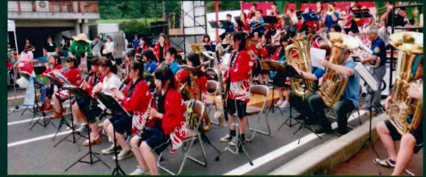
野球部が作ったステージで吹奏楽部の演奏。