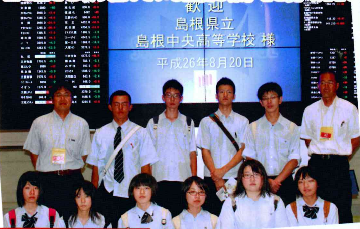
進学ゼミ東京研修