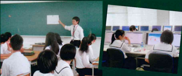
県内外から92名の中学生の皆さんが参加して、模擬授業、部活動、生徒会との交流会などを体験しました。