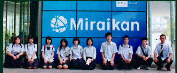
東京大学、東京証券取引所、国会議事堂、日本科学未来館、卒業生との交流会、難関大学生講話。