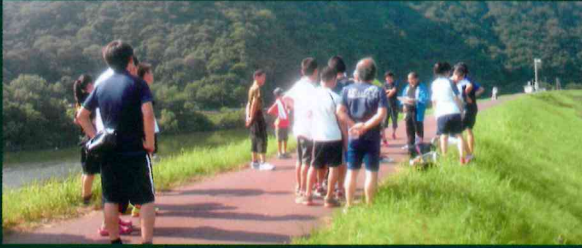
三江線再開通イベントに参加。リレーで列車と競争!!