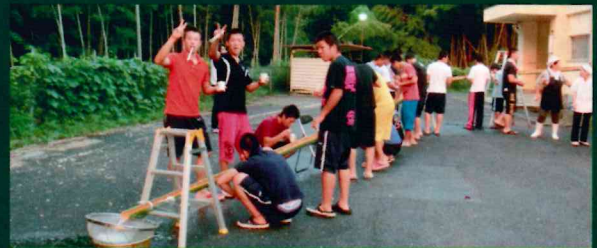
寮務部教員手づくりのそうめん流し機「中国太郎 4号」!!