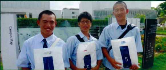
1・2年生希望者が岡山大学、広島大学へ。