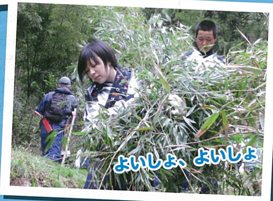
よいしょ よいしょ