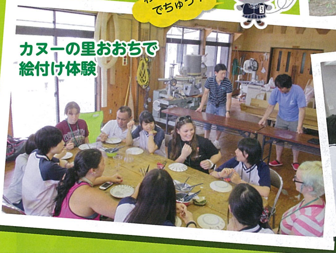
カヌーの里おおちで 絵付け体験