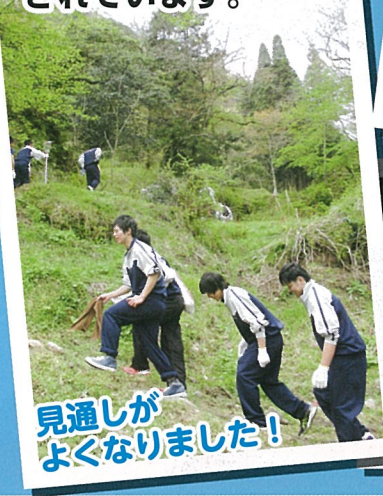
見通しがよくなりました!