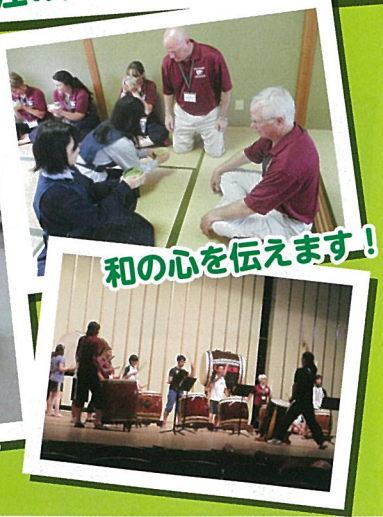
和の心を伝えます!