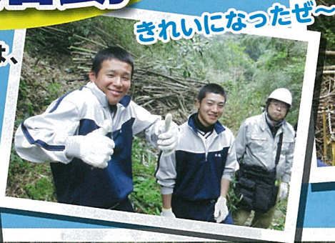
きれいになったぜ〜