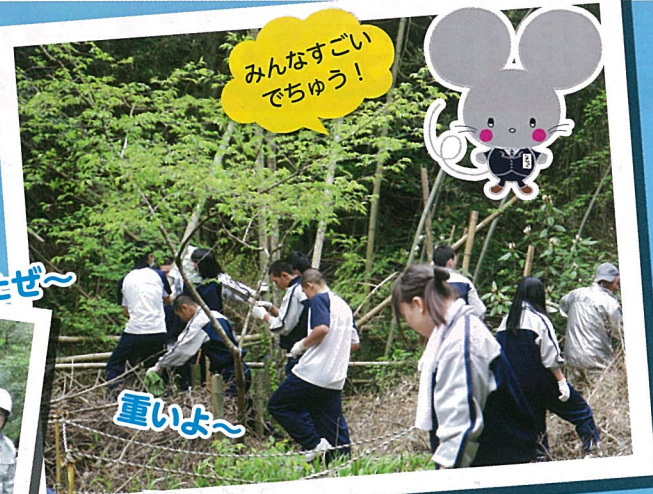
みんなすごいでちゅう!