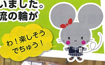
わ!楽しそうでちゅう!