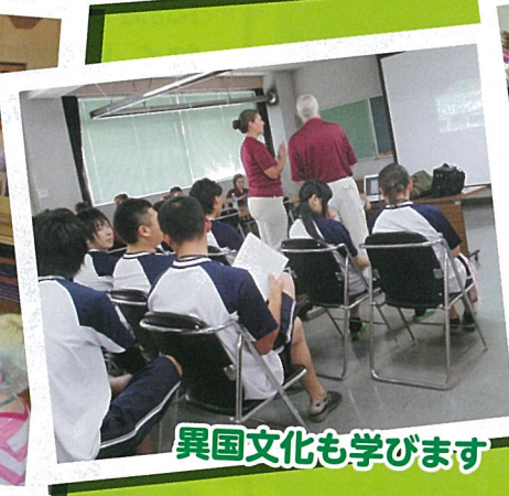
異国文化も学びます