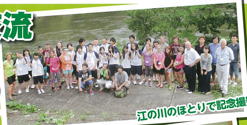
江の川のほとりで記念撮影

ユネスコスクール島根中央高校に、テキサス州カリスバークから交流をしにいらっしゃいました。今後も異文化交流の輪が広がります。